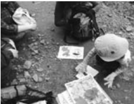
藻岩山 植物福笑い