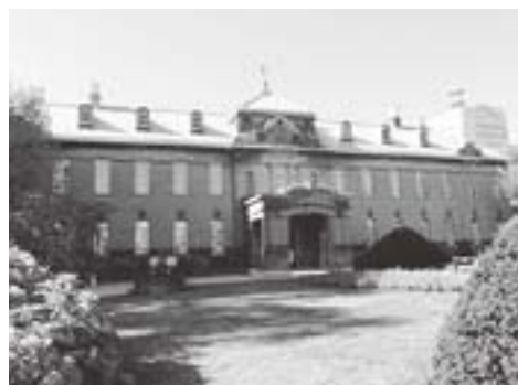
札幌軟石と支笏湖の関係とは?! (写真は札幌市資料館。)

支笏火山の大噴火から現在に至るまで、支笏湖や札幌の地形がどのように形成されたのかについてお話しいたします。札幌圏を含む石狩低地帯に住む方々にとっては「自分の足元の大地がどうやってできたのか」を知るチャンス。ぜひ聞いていただきたい内容です。若い世代のご来場もお待ちしております。