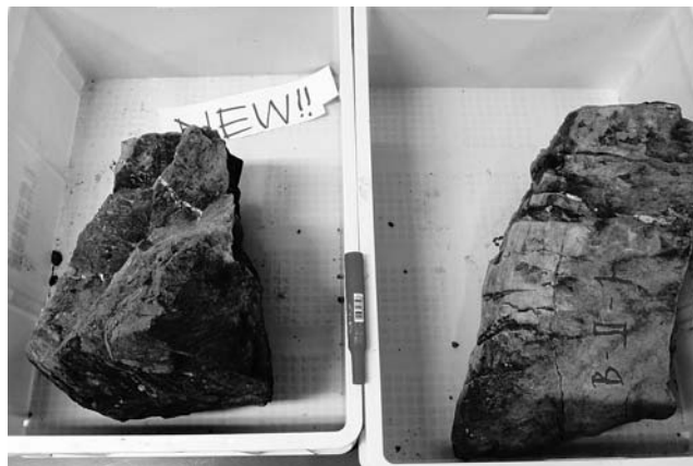
化石の入った岩 (9月19日採取)