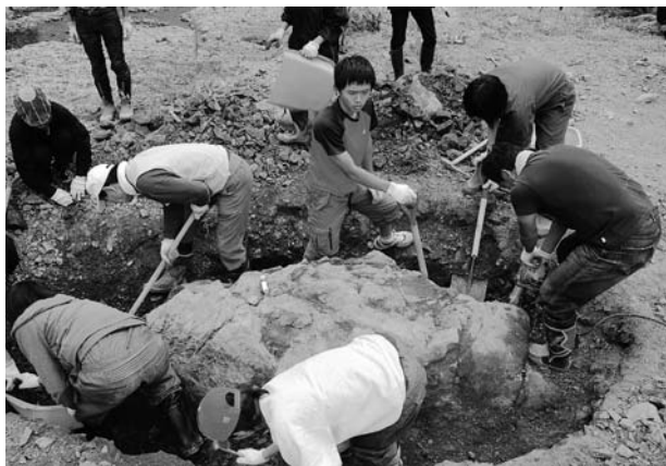
暗礁に乗り上げたクジラ?!

しかし、みんなでよってたかって作業しても掘り上げられないくらいの巨大な岩の塊の中にクジラ化石が入っていたのです！ 雪が積もる前に掘り出すことになりました。そう簡単には全体が見えてこないところも、化石にロマンを感じる一因なのかもしれませんね。