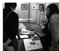
▲きっかけになったネズミイルカ(頭骨)。