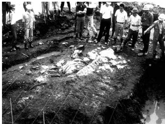
▲空知川の水をせきとめて発掘されたタキカワかいギュウ

私がかいギュウ化石に初めて出会ったのは1980年、今から28年前です。はじめはふつうのクジラだと思っていた化石が、実は大きなかいギュウの化石であるとわかったのは発掘から3ヶ月後のことでした。今からおおよそ500万年前の北海道に、独自に進化した大型のかいギュウが生息していたことがわかり、「タキカワかいギュウ」と名づけたのです。1987年、沼田町、ここで私はまた新たなかいギュウに出会いました。900万年前の地層から発見された化石は十分に成長した個体のものでしたが、復元しても4mほどで、7mを超えるタキカワかいギュウとは明らかに異なります。これを「ヌマタかいギュウ」と名づけ、大きな「タキカワかいギュウ」は小さな「ヌマタかいギュウ」から進化したのではないかと考えてきました。しかし、その生息年代には400万年もの空白期間があり、大型化した時期はなぞのままでした。そこに「サッポロかいギュウ」が発見されたの