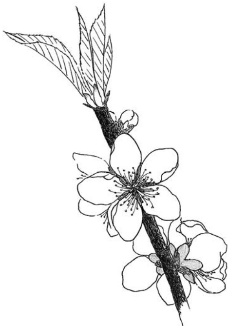
モモの花（イラスト：山崎真実）

このままでは北海道でも桃の節句にモモが咲くかもしれない！とさえ思えてきます。そのようなことにならないように祈りますが、気候変化に敏感に反応する植物や動物の動きをジッと観察することから大きな変化の前兆を見逃さないようにしたいものです。（山崎）