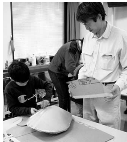
ゲンゴロウの模型をダンボールで作製中。