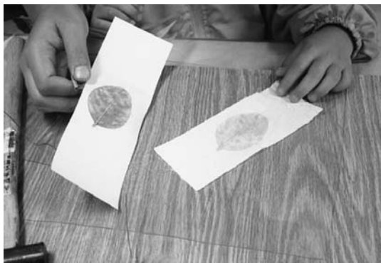
紅葉した葉の色をそのまま布に染め付けるたたき染めをしました。