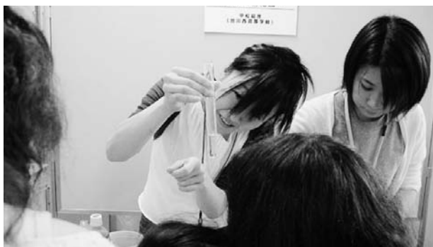
水の不思議な性質を実験。