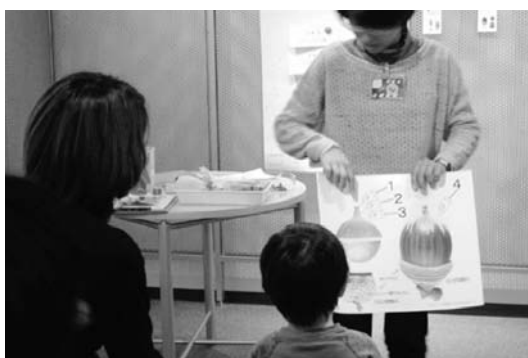
みなさん「ドングリ博士」になりました。