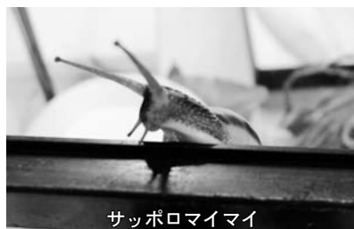
サッポロマイマイ

9月28日に持ち込まれたサッポロマイマイは、現在、研究室で飼育中です。(10月19日に冬眠に入りました。) (山崎)