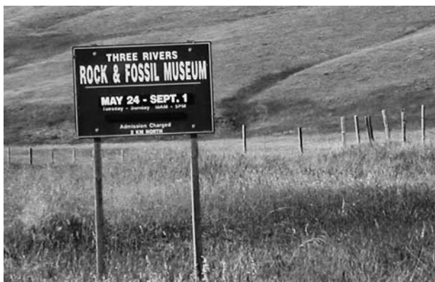
スリーリバーズ案内板

3号線をブロケットという小さな集落で右折し、510号線に入り、比較的大きなダム湖に沿って西に向かうと、北側には緩やかな斜面をもった台地が広がる。しばらく斜