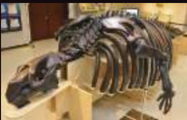
世界最古の大型海牛化石「サッポロカイギュウ」 の骨格標本もチカホに出現!