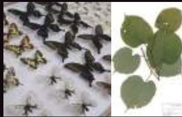
札幌に生きる植物・昆虫を展示します。 多様性に富んだ札幌の自然を見て感じる!