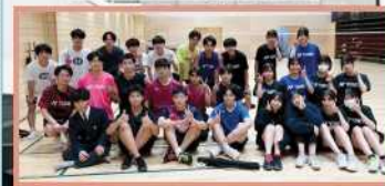
男子バドミントン部のみなさん