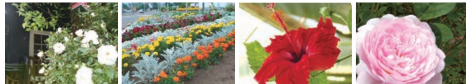
カフェレストラン「ヴィーニユ」