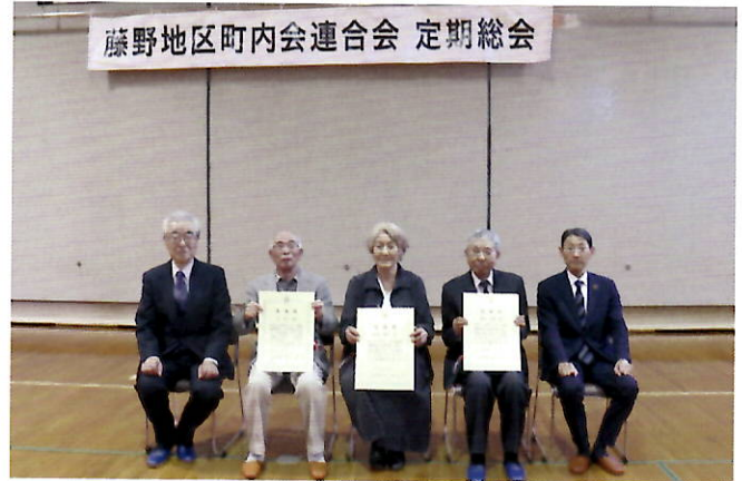
今様、飯盛様、岩崎様 左端：吉田町連会長、右端：藍原区長