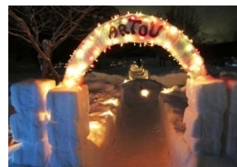
【札幌市立大学との連携「ARTOU（アートウ）」】