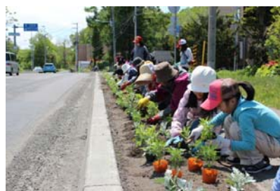
【沿道の花植え「花街道」の取り組み】