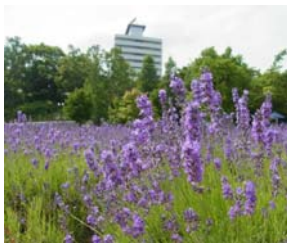
【東海大学との連携「南沢ラベンダーまつり」】