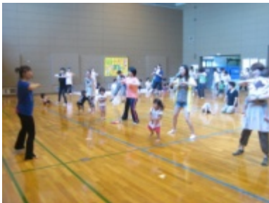
【親子でリズムっちゃお】