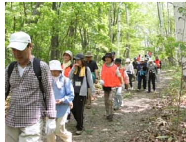
【新緑ウォーキング】