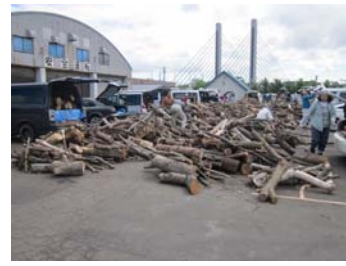
【剪定枝・枯損木などの配布】