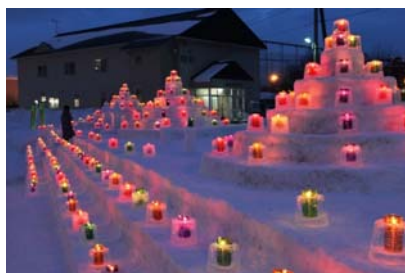
【「雪あかり」の取り組み】