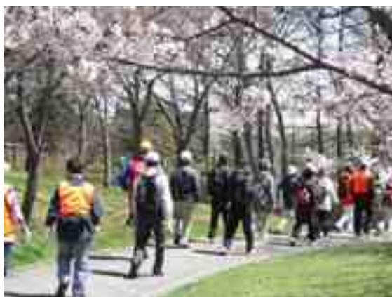
〈さくらウォーキング〉