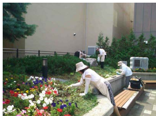
《地下鉄澄川駅前花植え》