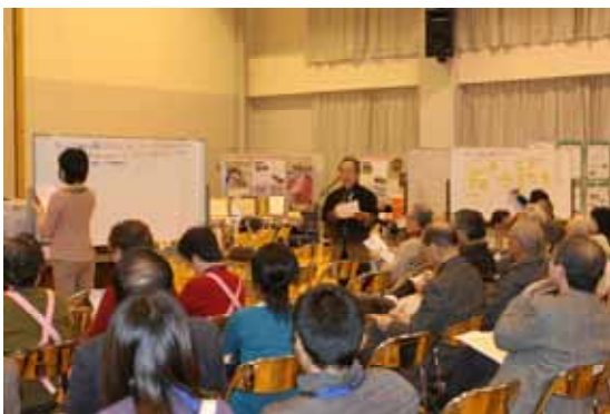
《まちづくり参加・入門教室》