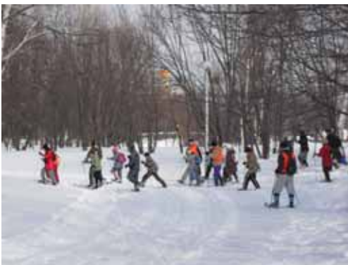
《スノーシュー・ウォーキング》