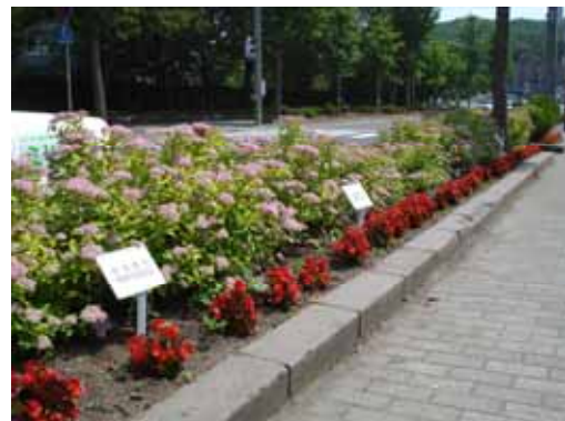
《地下鉄真駒内駅前植栽》