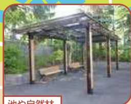
池や自然林、藤棚あり。