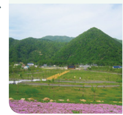
▲小金湯さくらの森