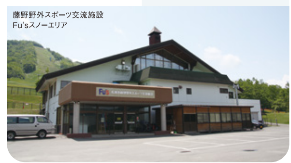
藤野野外スポーツ交流施設 Fu'sスノーエリア