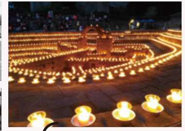
幻想的な明かりに包まれる、2019年のキャンドルナイトの様子。