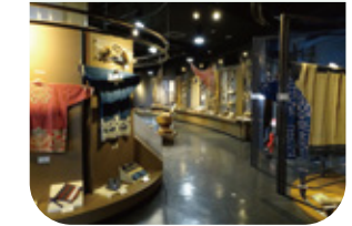
▲アイヌ文化交流センター