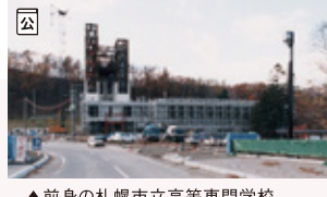
▲前身の札幌市立高等専門学校