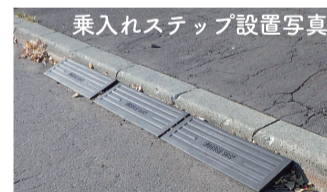
乗入れステップ設置写真

道路上に乗入れステップを置きっぱなしにしないでください。 積雪時は除雪の著しい妨げになるほか、除雪機械の損傷や作業者のけがにつながる恐れがあります。