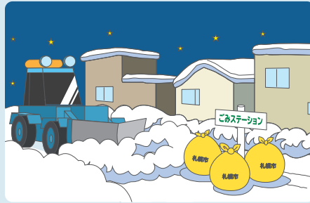
前日、深夜のゴミ出し

除雪車が通れなくなるほか、ゴミが雪で隠れていたときにゴミを撒き散らしてしまふことがあります。