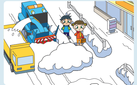
雪を道路に捨てる行為

通行する人の妨げになったり事故の原因になり大変危険です。また、排雪する雪の量が増えてしまいます。