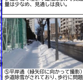
⑤平岸通（緑矢印に向かって撮影） 歩道除雪がされており、歩行に問題なし。