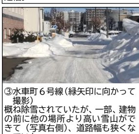
③水車町6号線（緑矢印に向かって撮影） 概ね除雪されていたが、一部、建物の前に他の場所より高い雪山ができて（写真右側）、道路幅も狭くなっていた。