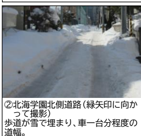
②北海道大北側道路（緑矢印に向かって撮影） 歩道が雪で埋まり、車一台分程度の道幅。