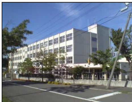
(もみじ台南小学校 昭和53年度開校)

今後、学校の壁に取り付けられた卒業記念制作作品を取り外すなど、新しい学校としてふさわしい形でスタートできるよう準備を進めます。これまでの思い出の品をそのままの姿で残すことはできませんが、デジタルカメラで撮影し、電子媒体でデータを保存したうえ、見たい時にはいつでも見られるような工夫をしていきたいと考えています。なお、校旗、校章については、統合校の中に記念のコーナーを設け、展示することを検討しています。