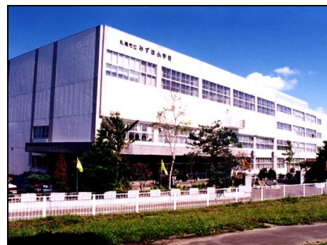
(みずほ小学校 昭和50年度開校)

また、統合に伴う改修工事は来年度以降も引き続き行い、トイレの洋式化などの改修を行いたいと考えています。