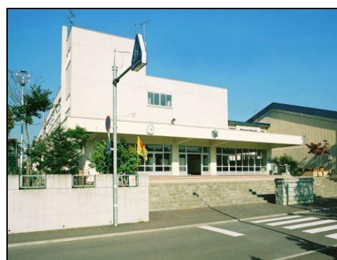
（もみじ台小学校 昭和47年度開校）