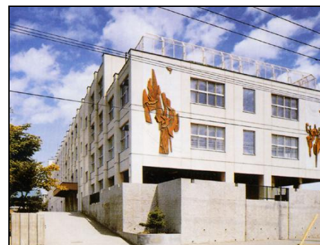
(もみじ台西小学校 昭和54年度開校)

また、閉校するもみじ台小学校のミニ児童会館も閉館となりますが、新たに来春からもみじの丘(現:みずほ)小学校にミニ児童会館が設置される予定です。