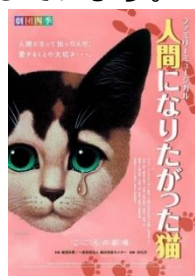
ミュージカル体験事業