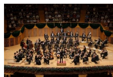
パシフィック・ミュージック・サッポロ・シティ・ジャズ フェスティバル (PMF)

7月にはクラシック音楽イベントのPMFやジャズ音楽イベントのサッポロ・シティ・ジャズ、11月には様々な芸術を見たり聞いたりできるアートステージ、3年に一度開催される札幌国際芸術祭(SIAF)は、今年度はさっぽろ雪まつりと一緒に実施します。