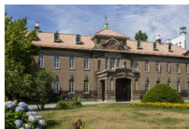
札幌市資料館 (1926年完成)