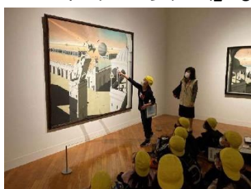
ハロー!ミュージアム