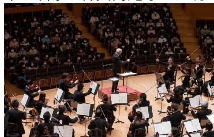
kitaraファースト・コンサート

全小学生に本物のクラシック音楽を体験してもらう「kitaraファースト・コンサート」 や、芸術の森美術館などに行く「ハロー!ミュージアム」などを実施しています。