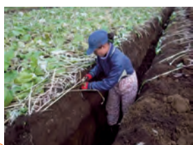
ごぼうを収穫するようす