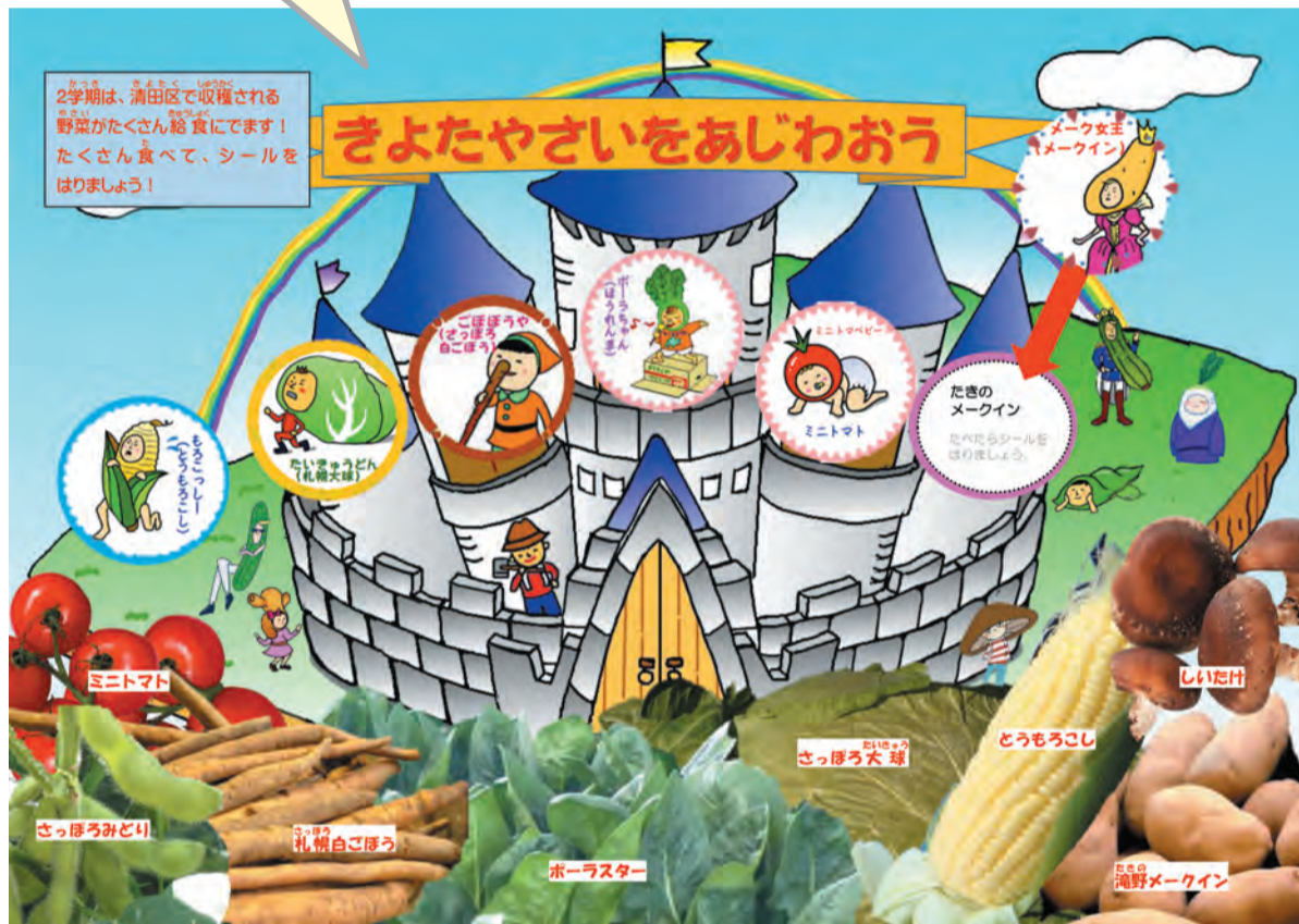
きよたやさいシール台紙

清田区内の小中学校では、清田区でとれるポーラスターほうれん草をはじめとした野菜を「きよたやさい」と名付け、JAさっぽろご協力のもと学校給食で提供しています。この取組で子どもたちが食材に興味・関心を持ち、感謝して食べる態度を培うことを目的とし、給食提供時には資料やビデオ、テーマソングなどで、きよたやさいについて学びます。