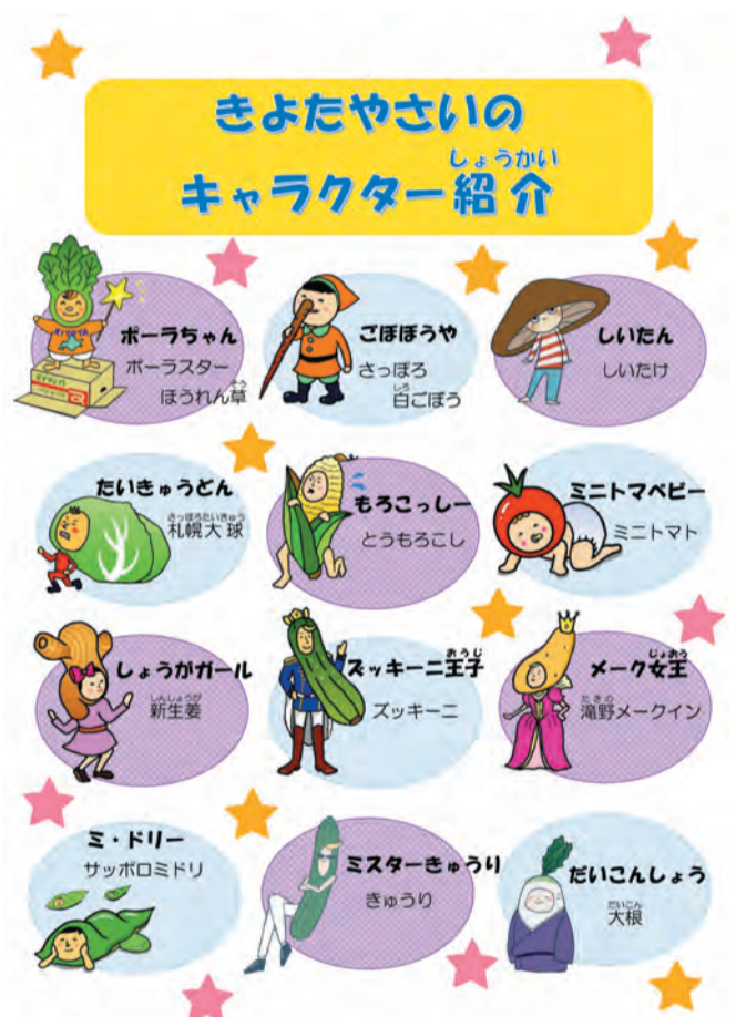
きよたやさいキャラクター