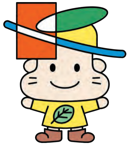
清田区マスコットキャラクター：きよっち