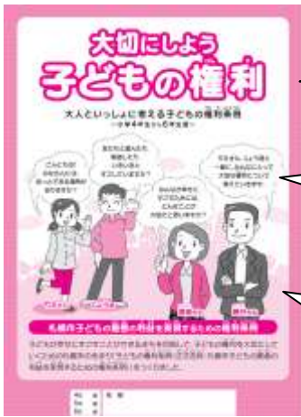
【子どもの権利パンフレット】