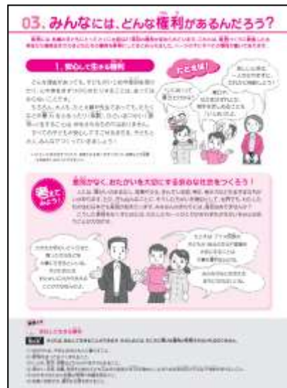
【子どもの権利パンフレットP4】