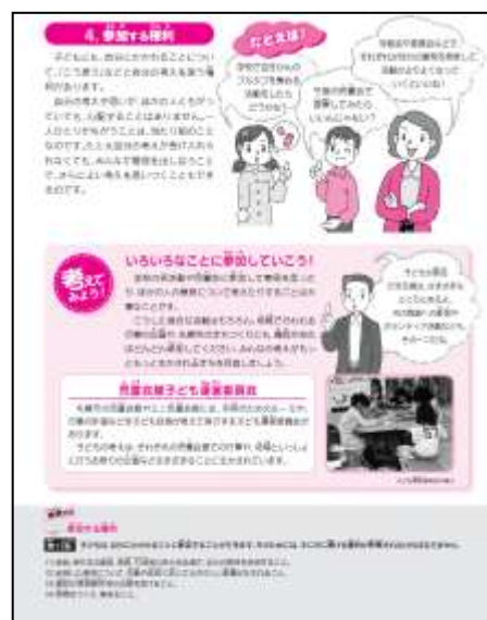
【子どもの権利パンフレットP7】