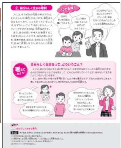
【子どもの権利パンフレットP5】