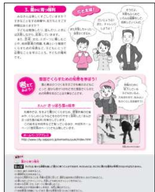
【子どもの権利パンフレットP6】