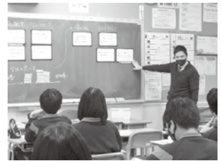
ホワイトボードを用いて、生徒の考えを交流する道徳科の授業

また、 学習状況及び道徳性に係る成長の様子 を見取り、そのよさを子どもに伝え、一人一人の成長を促すことが大切です。