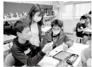
ICTを活用しながら協働して課題解決に向かう授業