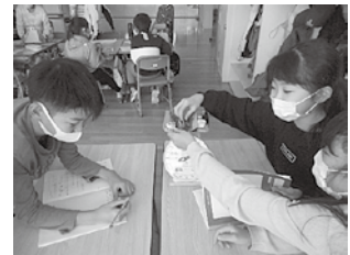
学ぶ意欲を育む体験的な活動を取り入れた授業