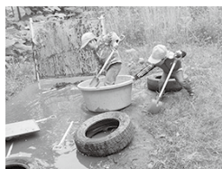
共通の目的の実現に向けて、協働と試行錯誤する子ども