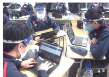
ディベートに向けて論点を整理