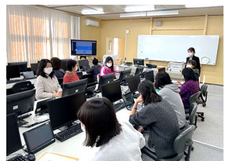
GIGAスクールサポーターによる校内研修