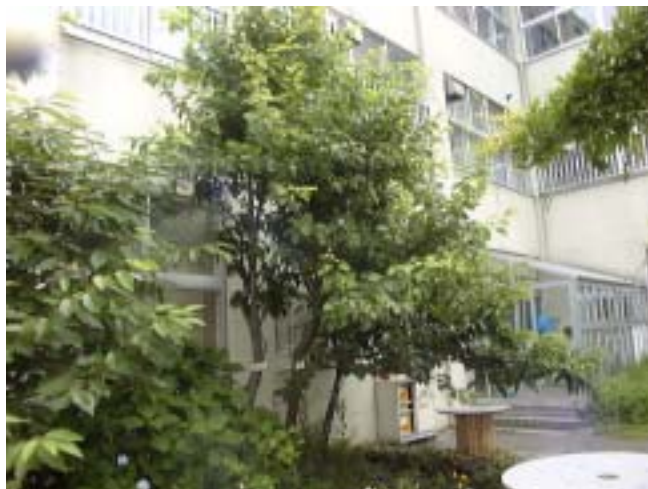
- 5 プルーン