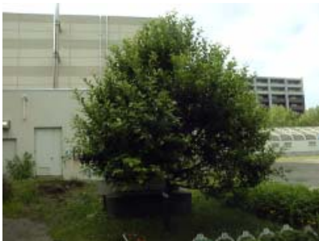
- 8 かりんず・グスベリ