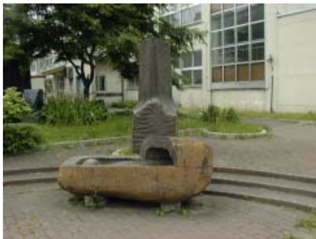
北海道庁立札幌高等女学校記念碑