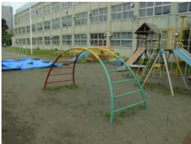
- 5 木製アスレチック的遊具