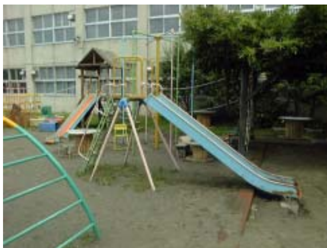
- 2 すべり台・ジャングルジム