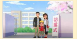
<Created by MEXT>