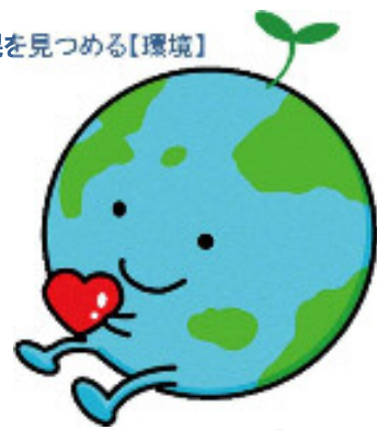
【環境】キャラクター「ちつきゅん」