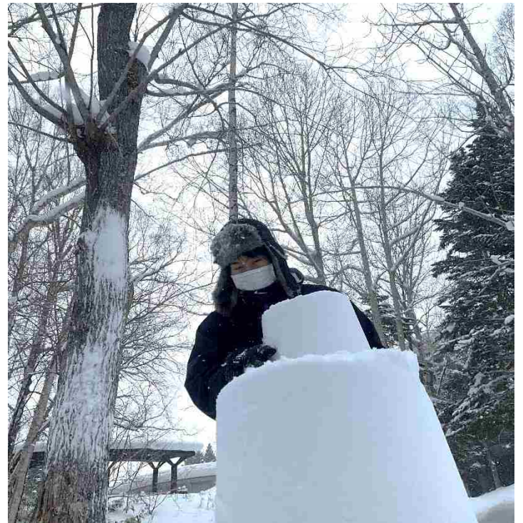
午後からは、外の活動。 雪基地づくりです。