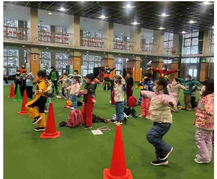
山の家に戻って、退館式です。 今日一日の出来事をみんなで振り返りました。