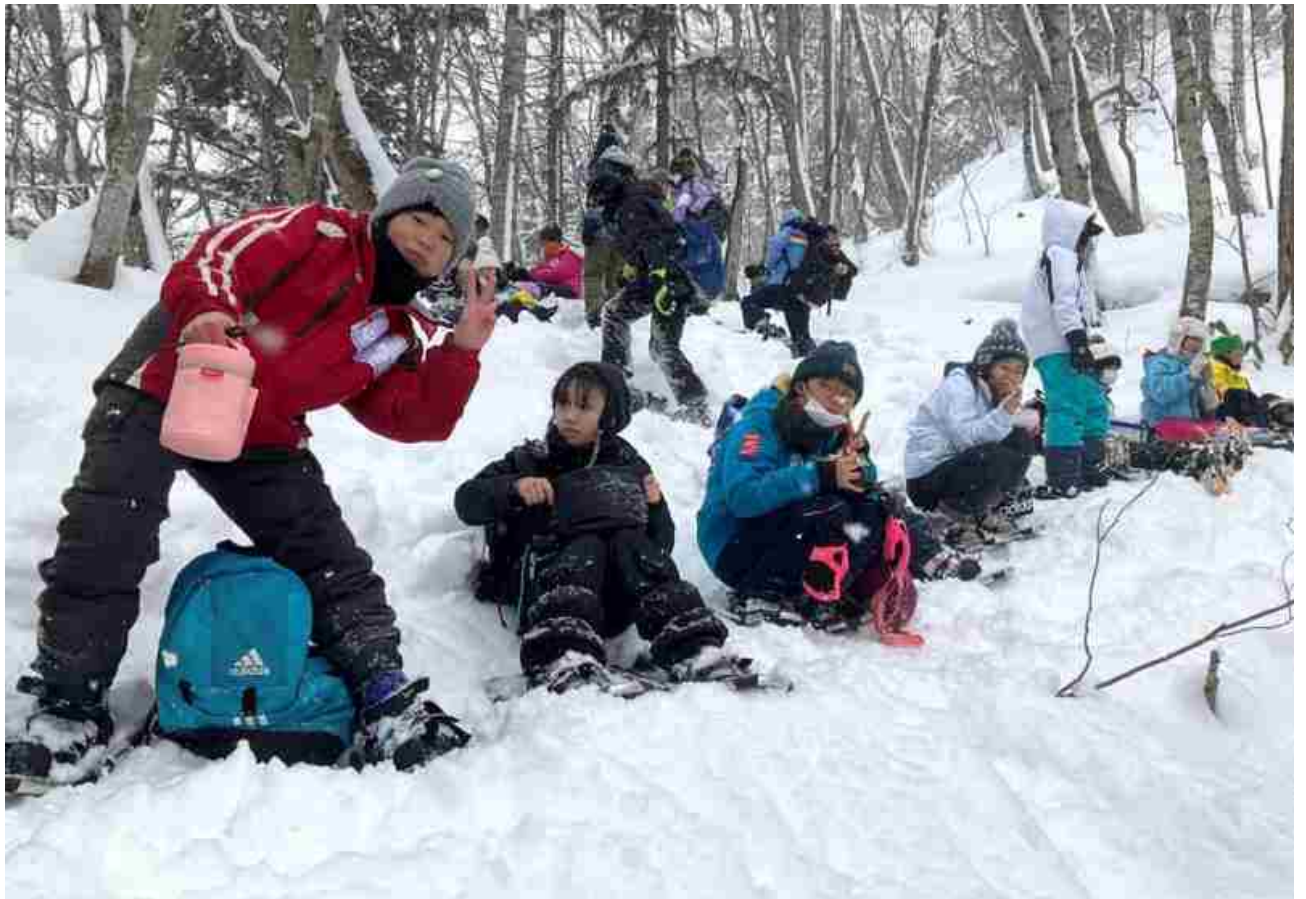
やっと頂上に到着！待ちに待ったお弁当タイム！