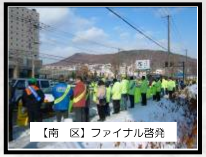
【南 区】ファイナル啓発