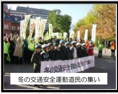
冬の交通安全運動道民の集い