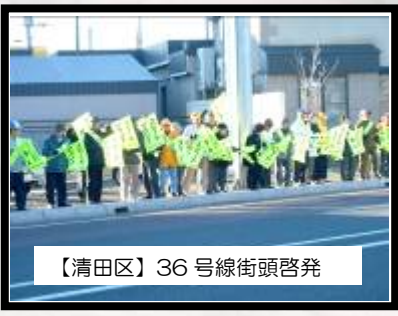
【清田区】36号線街頭啓発