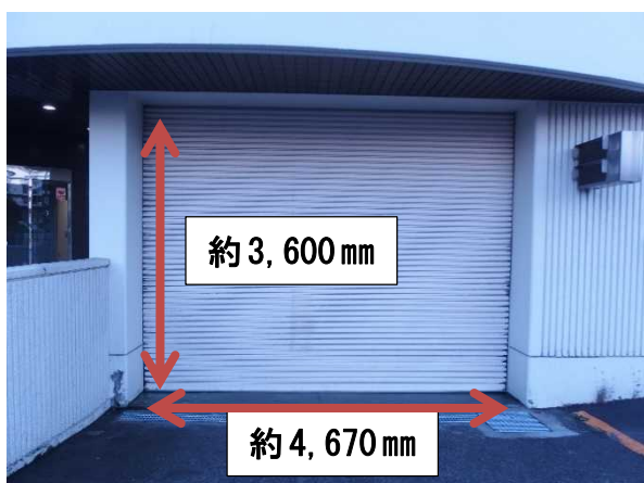
シャッター正面（外部側）