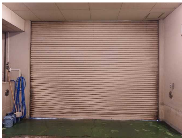
シャッター正面（建物側）