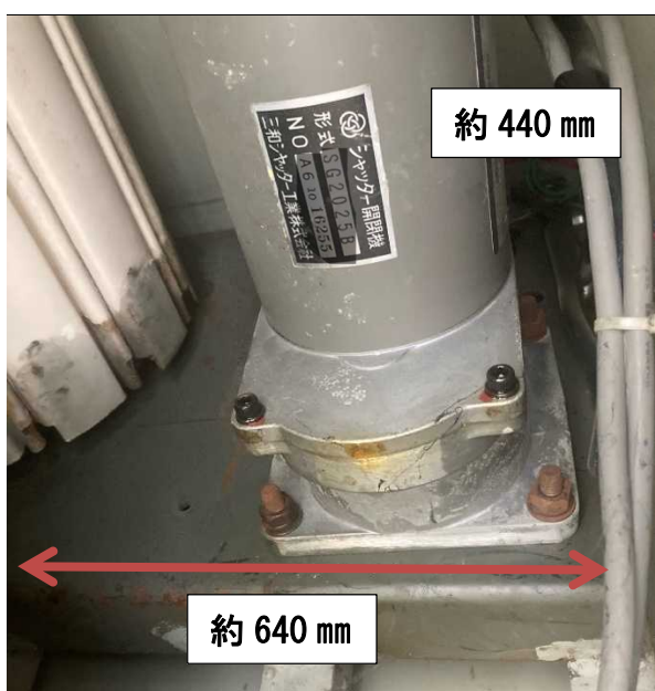
駆動側ブラケット