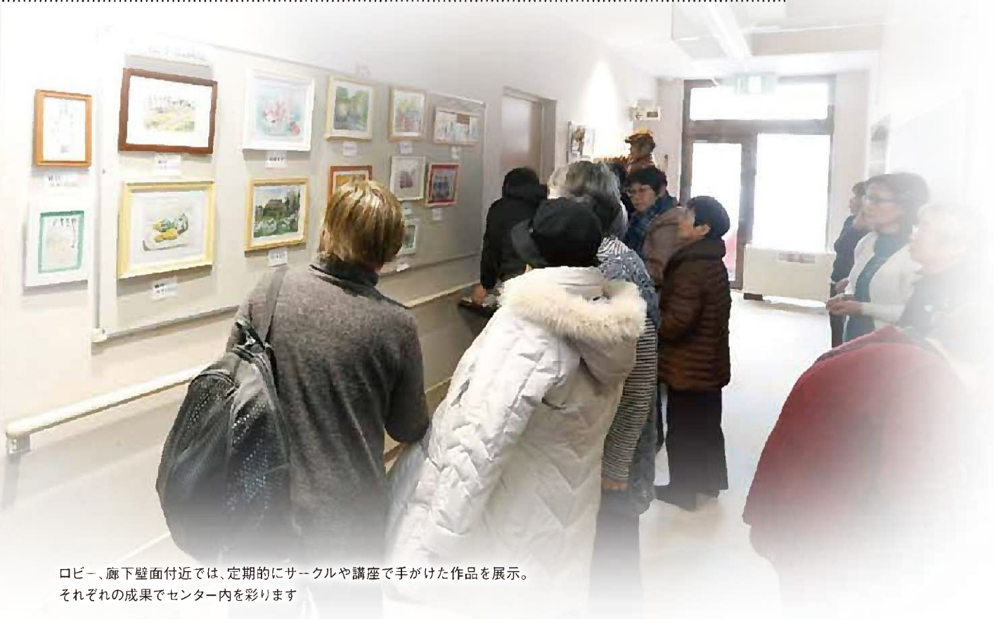
ロビー、廊下壁面付近では、定期的にサークルや講座で手がけた作品を展示。それぞれの成果でセンター内を彩ります