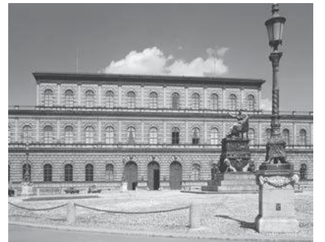
ヴィッテルスバッハの居城「レジデンツ」