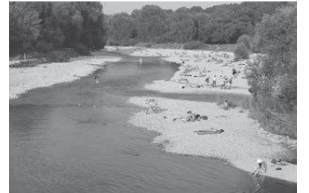
イザール川

第2次世界大戦では、ミュンヘンの45%が瓦礫の山と化しましたが、見事に復興を果たし、1972年には夏季オリンピックが開催されました。この大会を機に地下鉄や郊外電車が整備され、今日の経済発展へとつながりました。