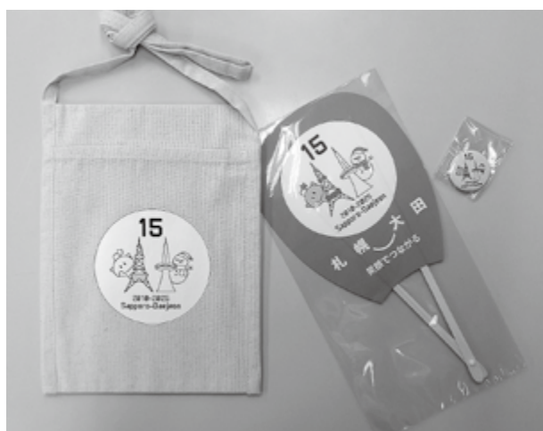
サコッシュ・うちわ・缶バッジ