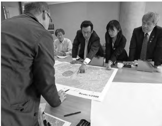
2016年9月 ポートランドでのまちづくり視察