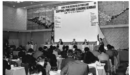
1988年10月 札幌で開かれた「札幌・ポートランド経済セミナー」