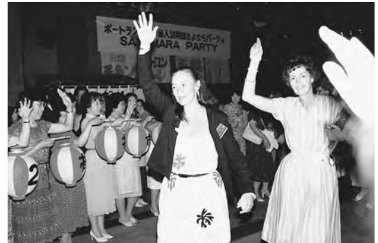
1983年7月 少年婦人訪問団さよならパーティ