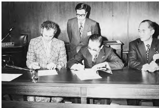
1973年11月 交換職員プログラムを取り交わす