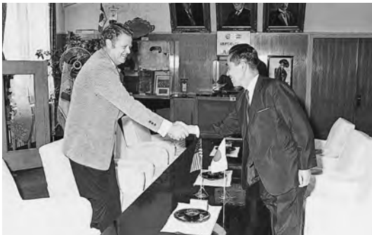
1971年7月 ハワード P. トレーパー市長補佐が板垣市長訪問