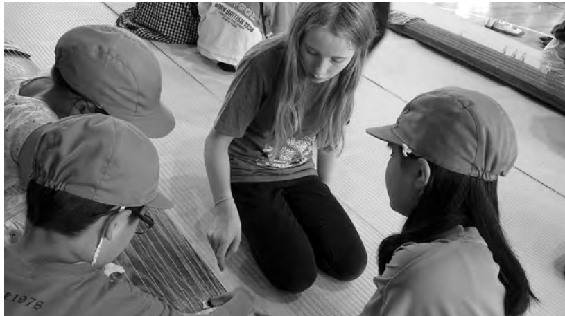
4年生と行ったお琴の演奏体験の様子

宮の森小学校ホームページ： https://www.miyanomori-e.sapporo-c.ed.jp/