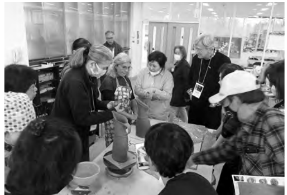
OPA会員によるデモンストレーションの様子