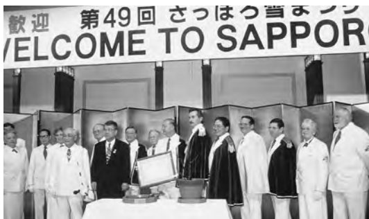
1998年2月 ポ市より雪まつり訪問団、ロイヤルロザリアン(バラの騎士)来札