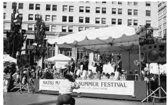
1994年8月 姉妹都市提携35周年記念行事で盆おどりを披露