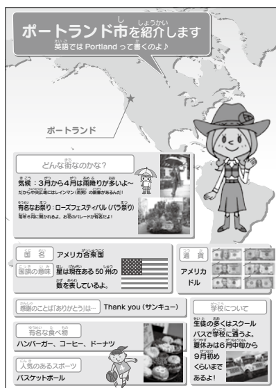
ポートランドを紹介する子ども向けパネル

札幌姉妹都市協会は、設立当初は市からの補助金に加え、多くの市民、企業等からの寄付金で運営され、姉妹都市との交流プログラムの実施や助成等を行っていましたが、2012年4月に約40の関係団体による組織へと改編され、以降札幌国際プラザと一体となって姉妹都市交流事業を進めています。