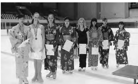
2004年7月 フィギュアスケート国際交流大会