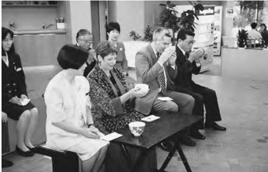
1994年10月 35周年記念で行われた天神山国際ハウスでの茶道体験