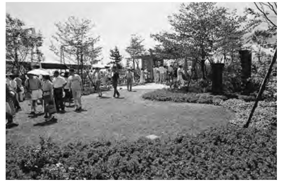
1986年6月 花と緑の博覧会会場のポートランド庭園