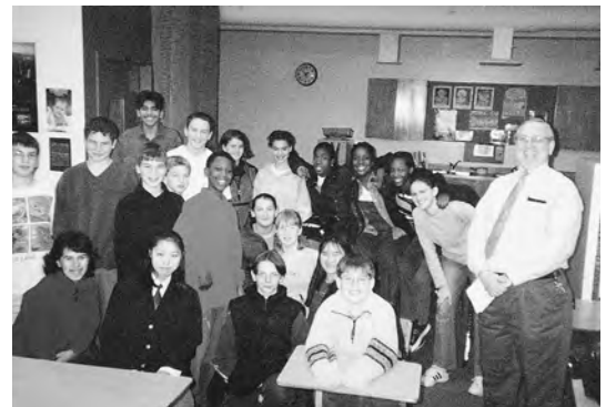
2000年1月 40周年記念姉妹校訪問団