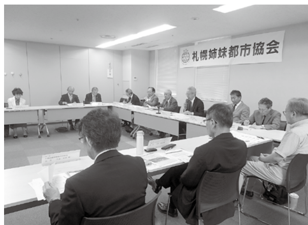
札幌姉妹都市協会総会にて関係情報の共有・交換

札幌姉妹都市協会は、今後も、札幌市と各姉妹・友好都市との友好親善と交流の拡大発展を図って活動していきます。