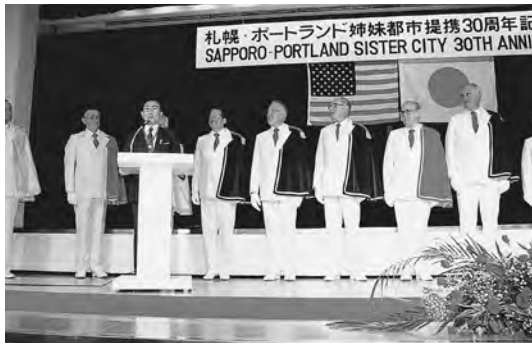
1989年9月 姉妹都市提携30周年記念式典