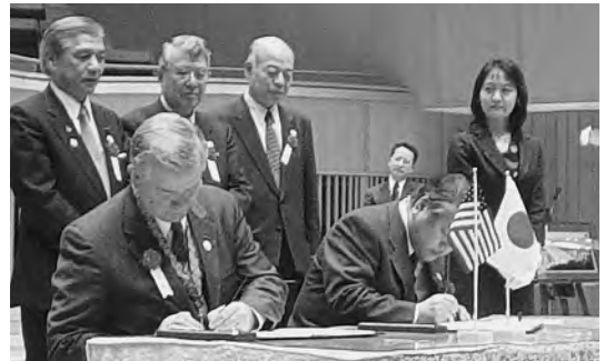
2005年2月 姉妹都市提携45周年記念再調印式