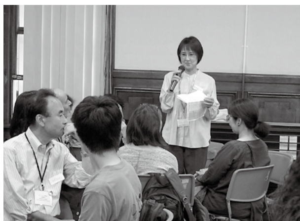
イベント「行ったつもりでポートランド」での通訳・運営補助活動