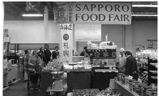
2018年8月 宇和島屋での札幌物産展開催