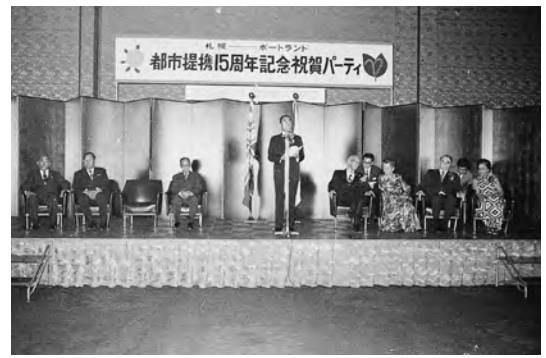
1974年11月 姉妹都市提携15周年記念パーティ