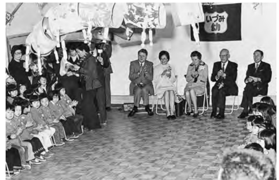
1974年11月 シュランク前市長がいづみ幼稚園を訪問