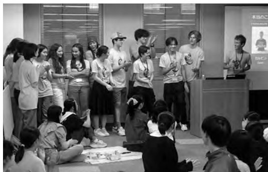
【2024年 グラント高校生受入】 [Let's Talk English 高校生スペシャル]