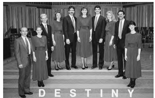
1989年6月 ポートランドバイブルカレッジ聖歌隊が来札