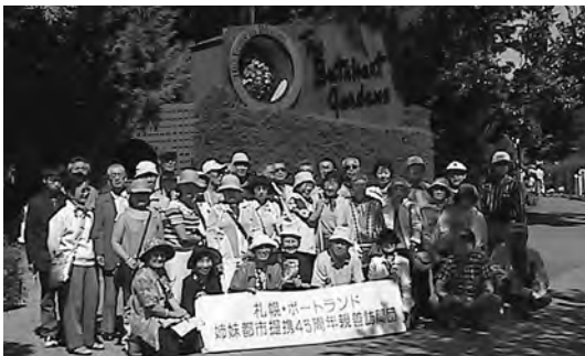
2004年6月 45周年ポートランド訪問