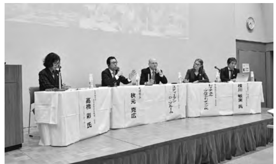
2018年12月 フォーラム「札幌・ポर्टランド～姉妹都市関係の未来」開催