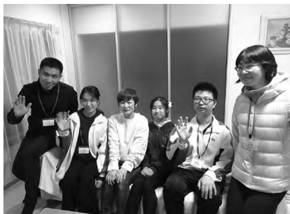
「JENESYS2024中国高校生訪日団」ホームビジット受入の様子

1986年（昭和61年）に「ホームステイ7区連絡会」として、当時札幌のホームステイ制度登録家庭の情報交換などを目的としたネットワークとして設立され、財団法人札幌国際プラザの設立に伴って「札幌ホームステイ協会」と改称。ホームステイ登録家庭同士での交流会の実施や広報誌「かけはし」の発行など、ホームステイ家庭としてのホスピタリティーの向上を目指して活動しています。