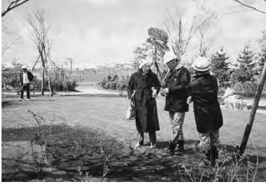
1985年8月 ポートランド庭園設計者の来札