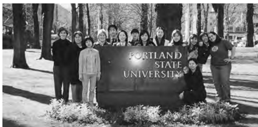
2001年3月 大学生英語研修派遣