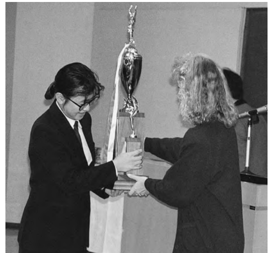
1989年11月 熱弁をふるったあとの授賞式(高校の部)