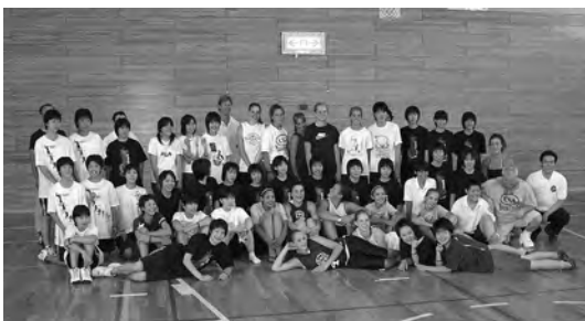
2006年8月 国際親善ジュニアスポーツ姉妹都市交流