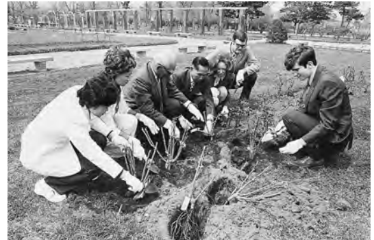
1972年5月 ポートランドから贈られたバラの苗木を百花園に植える