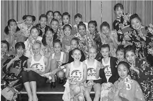
2003年10月 札幌ライラックオープン新体操大会