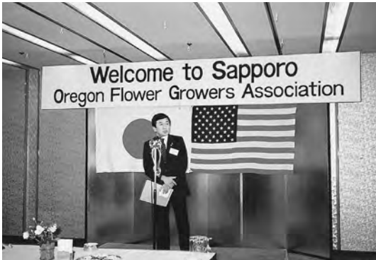
1985年10月 オレゴン花き生産者協会が姉妹団体交流で来札