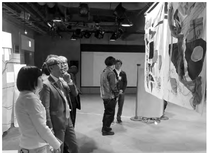
札幌市立大学の学生による成果展の様子

2024年（令和6年）3月には、その体験と記録をドローイング、映像、フォトルポルタージュなどの多彩な形式で展示作品として表現し、学生たちそれぞれの視点でポートランドの文化の魅力を伝える成果展を行うなど、精力的な活動を行っています。