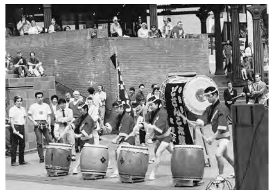
1992年5月 ポートランド市で開催されたアメリカ・ジャパンウィークでどさんこ太鼓を披露