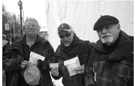
2010年2月 ポートランド雪像作りチーム来札