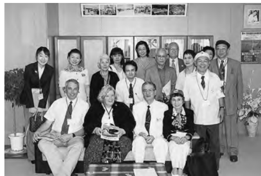
2002年9月 病院ボランティア国際フォーラム