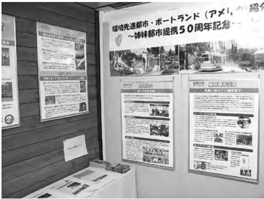
2009年2月 雪まつり会場のブースで50周年をPR