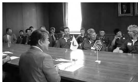
2003年8月 ポートランド少年野球訪問団の上田市長表敬