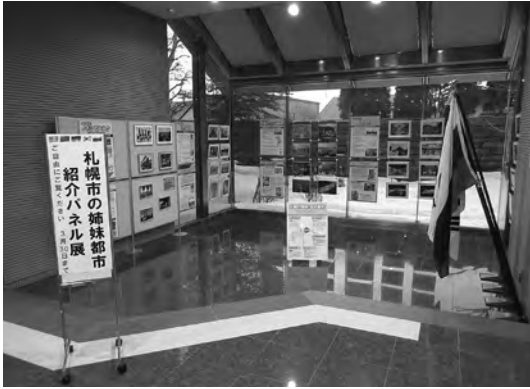
2015.02 姉妹都市紹介パネル展