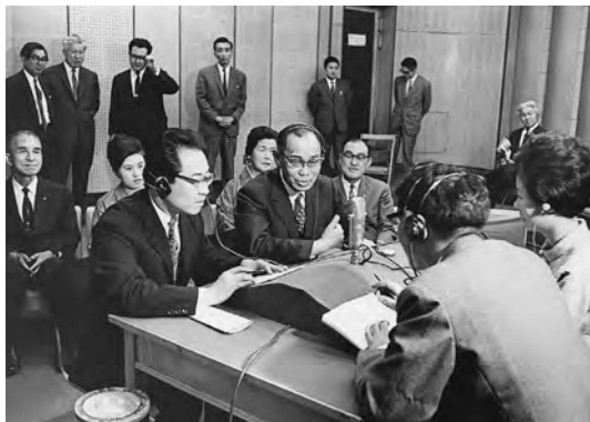
1964年6月 北海道放送のスタジオで国際電話「ハロー・ポートランド」