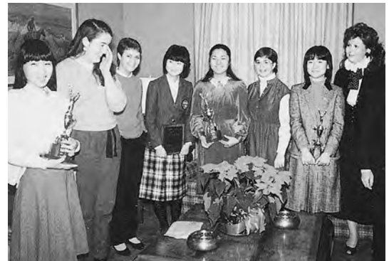
1983年12月 ポートランド市長を訪問する英語弁論大会親善使節