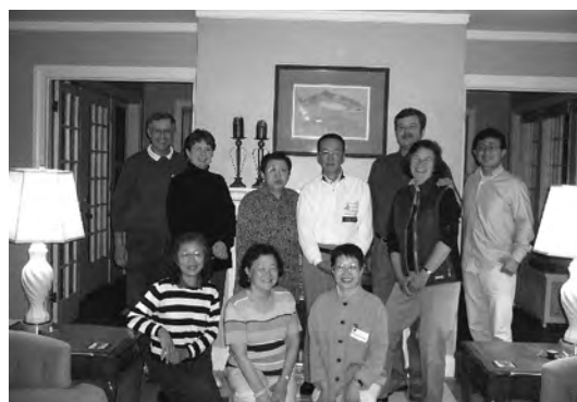
2007年6月 ローズフェスティバル100周年訪問団とPSSCA