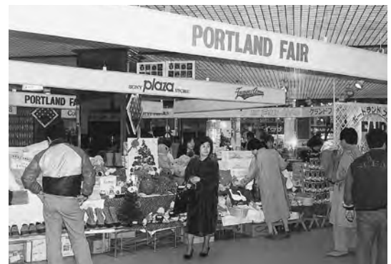
25周年記念に開催されたポートランド物産展