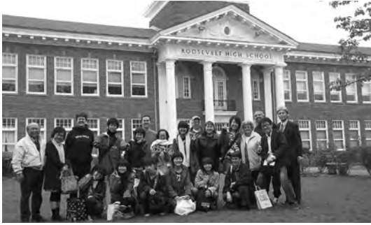
2008年10月 新川高校とルーズベルト高校との合同写真