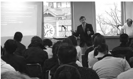
2006年12月 姉妹都市ポートランドを知るセミナー ～市民がまんなかのまちづくり～