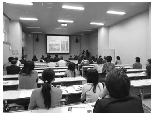
2014年4月 市立高校生ポートランド派遣帰国報告会