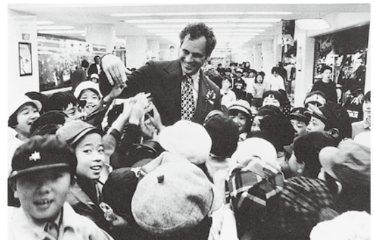
1972年9月 ゴールドシュミット次期市長を囲む子どもたち