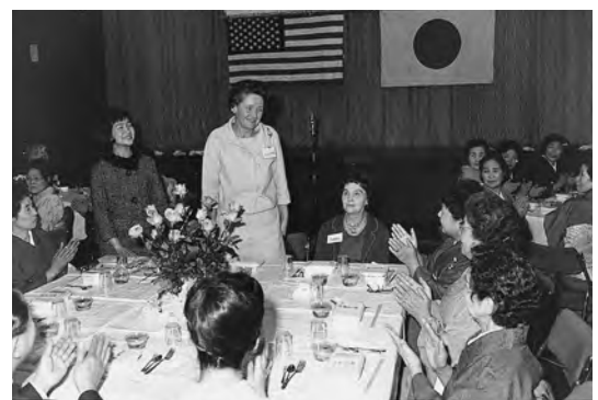
Lunch party at Woman's Hall

1月・札幌エスペラント会～ポートランド世界理解委員会が提携 2月・鉾山技師・秋葉安一氏がポ市に市内で産出したアンチモニー鉱物標本の学校教材を贈呈 4月・ポートランド貿易促進委員会(団長 シュランク市長)33名が来札 ・オレゴンカメラクラブが全日本写真連盟札幌支部に作品95点を贈呈し、6月に丸井デパートで展示会 ・阿部謙夫提携副委員長・北海道放送社長が訪ポし、ポ市に映画『丹頂鶴の生態』を贈呈 ・札幌交響楽団がポ市に市民コンサート録音テープ2本を贈呈 ・札幌市がポ市庭園展示会に植木を贈呈 ・旭丘高校～ジェファーソン高校が提携