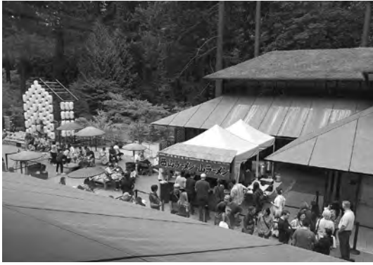
2019年8月 札幌カルチャーフェスティバル開催