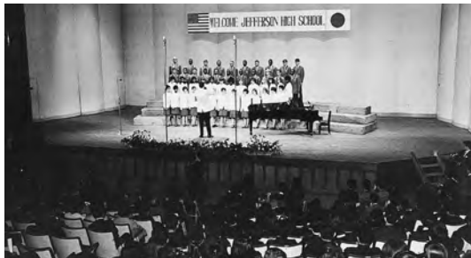
1967年4月 ジェファーソン高校合唱団札幌公演