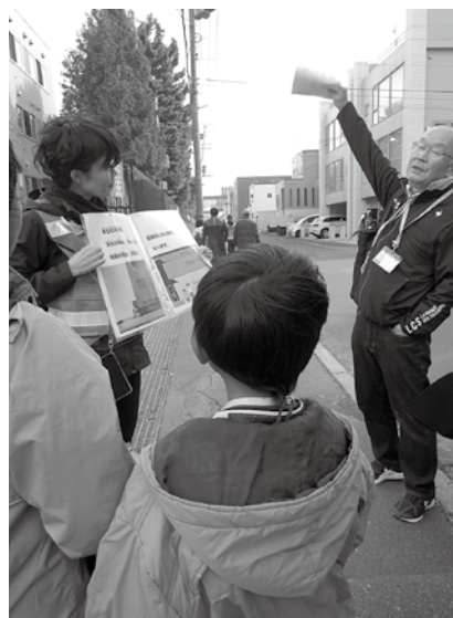
防災イベントでの通訳活動