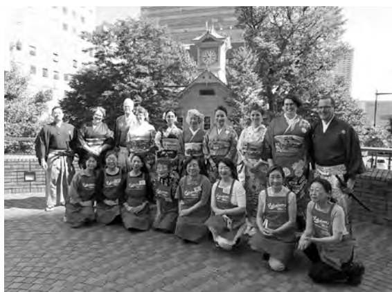
着付け(ポートランド親善訪問団)体験