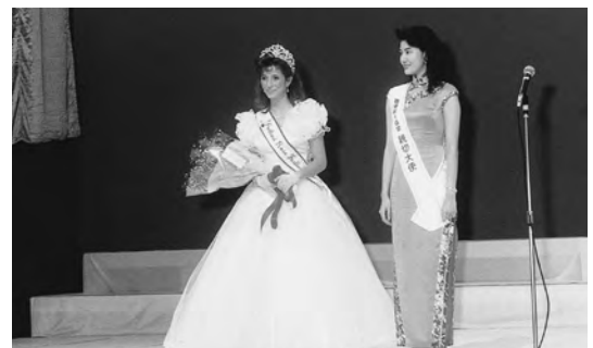
1989年2月 来札したバラの女王のクリー・マニングさん