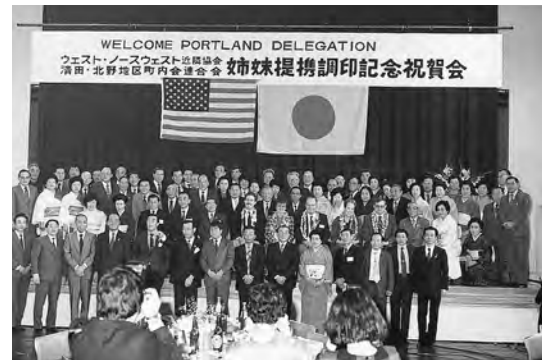
1984年11月 ウエスト・ノースウエスト近隣協会と清田・北野地区町内会連合会の姉妹都市提携調印記念祝賀会