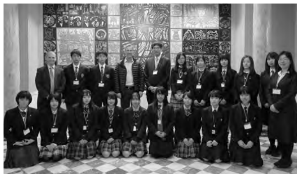
【2019年 札幌市立高校生派遣】 ウィーラー・ポートランド市長表敬訪問