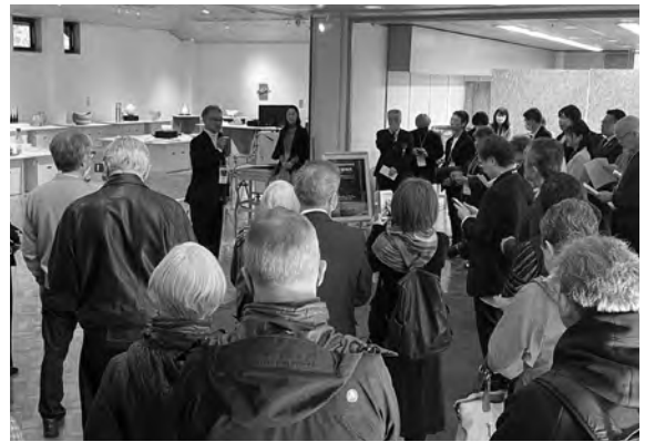
「陶・新時代」オープニングセレモニーの様子

北海道陶芸会ホームページ： https://hokkaido-pottery-society.jimdofree.com/