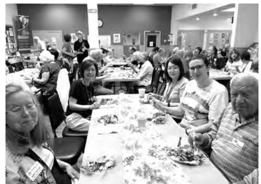
現地でのフェアウェルディナーにて

この特別な機会には、ポートランドの姉妹都市各国の代表も集まり、国際色豊かで心に残るひとときとなりました。ポートランド市長が「国境を越えた交流の大切さ」について語られ、その言葉がFFIの理念とも深く共鳴し、大変感銘を受けました。