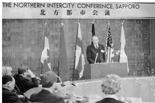
1982年2月 第1回北方都市会議で発表するアイバンシー市長