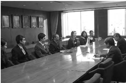
2012年1月 Grant 高校生生徒来札