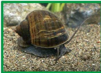
スクミリンゴガイ