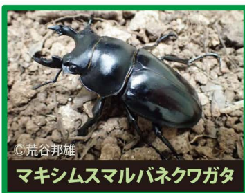
マキシムスマルバネクワガタ