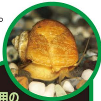
かんしょう用の ゴールデンアップルスネール

つかまえても、他の場所に持って行かないでね。飼っている貝は、池や川に放さないでね。