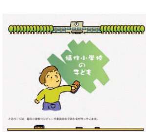
▲福住小学校子どものページ

福住小学校（豊平区）の児童委員会の一つ「コンピュータ委員会」では、学校の公式ホームページのコーナー『子どものページ』を子どもたちが作り、学校内のいろいろな出来事などを発信しています。