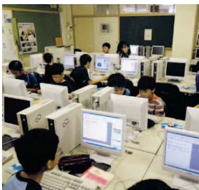
▲ポスター作りに熱心に取り組みました

七月の第四回委員会では、「福住小学校のいいところ」をテーマにパソコンで校内の子どものページを作りました。地域に開放されている「スクールバンドが活発」など、学校のいいところをどうやって紹介するかいろいろ考えていました。子どもたちは「図書館が分が作ったものをみてもいいな」「福住小はとも楽しなくて明るい学校なので、みんなに知ってもらいたい。」