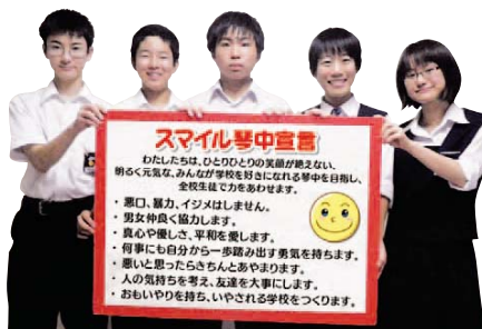
▲琴中のシンボルスマイル琴中宣言