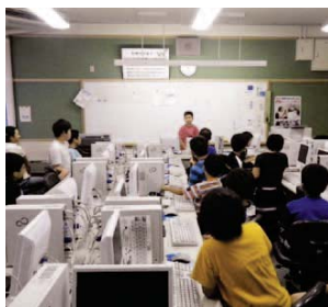
▲コンピュータ委員会のようす

福住小学校の「コンピュータ委員会」は小学五年生と六年生の二十二人が学校の委員会活動で、『子どものページ』にのせるための記事探しや、記事の編集作業などを行っています。昨年は校長先生、教頭先生へのインタビューや、クラブ活動や学校周辺のレポートを行い、その内容を学校のホームページで公開しています。