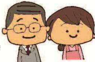
「きらり君」の保護者

※ 条例とは、市議会で制定する市のきまりです。「子どもの権利条例」の正式名称は、「札幌市子どもの最善の利益を実現するための権利条例」といいます。