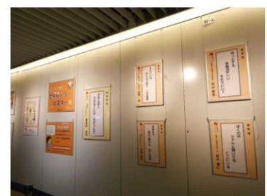
▲せんりゅう・ポスター展の様子