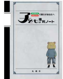
▲里親・ファミリーホーム用 (高学年版)