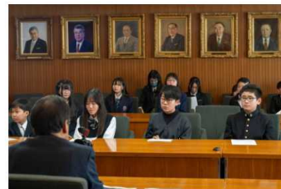
▲市長報告会の様子