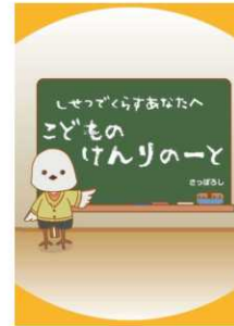
▲施設用 (幼児・低学年版)

また、令和6年度から、児童養護施設で生活している児童を対象に、意見表明支援員を派遣する事業を開始した。