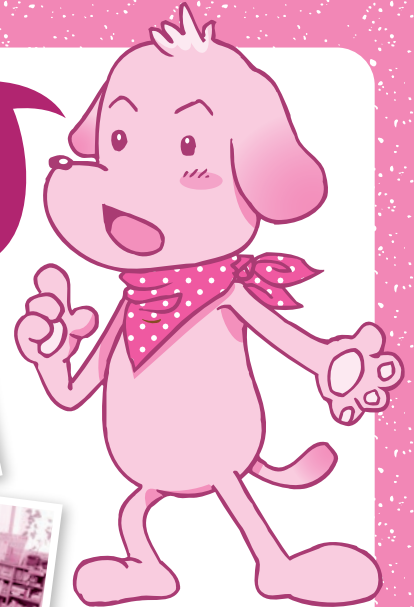
子どもアシストセンター マスコットキャラクター：ハッピー