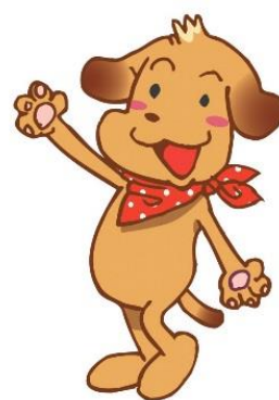
子どもアシストセンター マスコットキャラクター 「ハッピー」