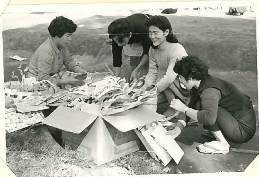
全地区の主婦達はこの様に我が子のため ならと/生果命のお平伝い。