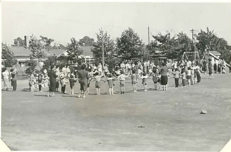
9月5日 巡回6日目 (お遊戯) 秋空の下でカッパお遊戯をする。 おかあさん方のお手伝い人がいらぬよ。―― 僕達だけが用さへば、子供達元気で全員参加。