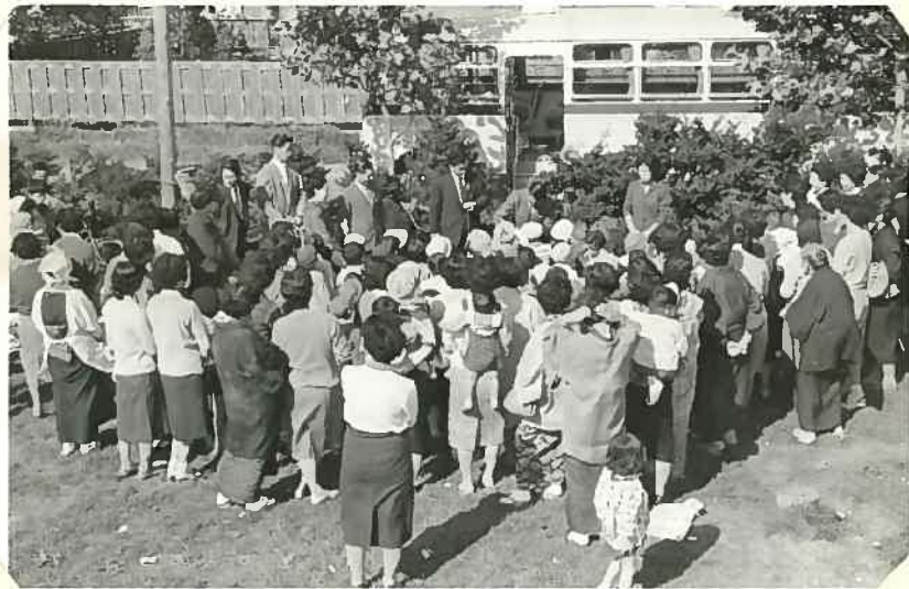
お'かあさん方も参加。 孫の顔を見よとして来た お'は'あちやも 見える。