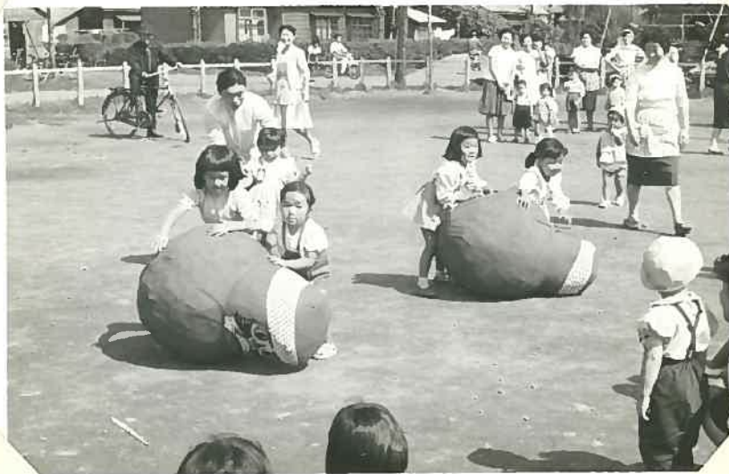
ゴールがもうすぐそばだよと1生懸命 に存子か 言うことのきかないガルマさん