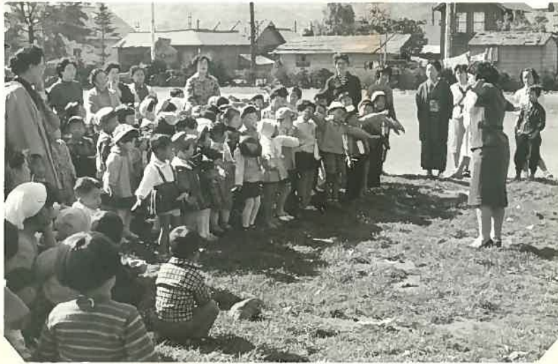
8月8日 巡回3日目 (ものまね遊戯) バスから降たらすいりボン別に整列 芝布の上でものまねお遊戯。(時計) 中には親から離れない子供もいる。 私達は時計ですと言った表情