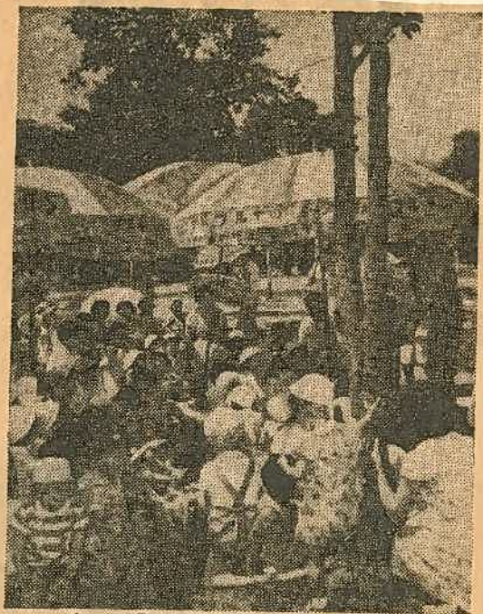
動くすこすこ楽しくの下でソルの子どもたち バスの下で遊ぶ子どもたち 児童館のバス