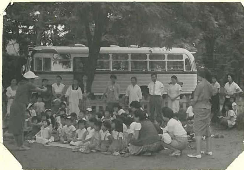
9月1日巡回6日目 (手遊戯)

おち付なかった子供達も6日目にはこのとおり アコーディオンに合わせて、お歌のけいこ 楽器 そのもものも珍しう。