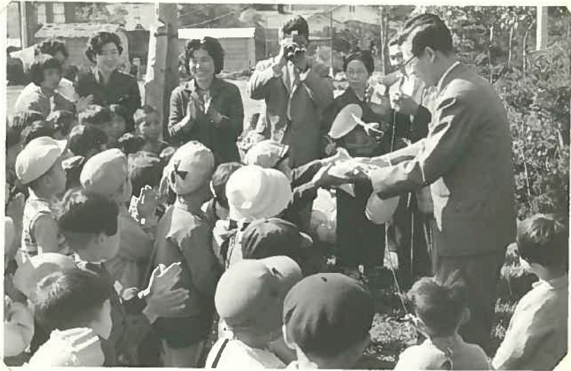
10月10日 終了の日 小杉社会課長から おみやげと おもでのしおり を戴く子供達