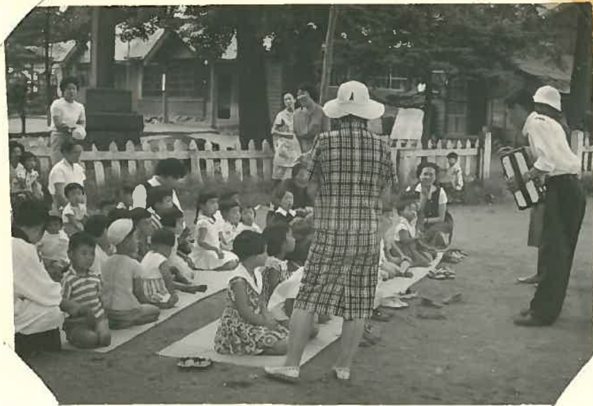
9月1日巡回6日目 (唱歌けいこ)

おち付なかった子供達も6日目にはこのとおり アコーディオンに合わせて、お歌のけいこ 楽器 そのもものも珍しう。