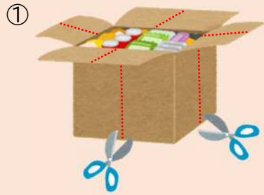
赤線部分をカットする。