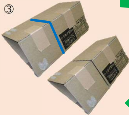
三角形のものが完成！これを2つ作って、 罫線部分の隙間に他の段ボールを差し込む！