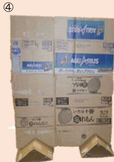
自立する間仕切り(壁)が完成！！