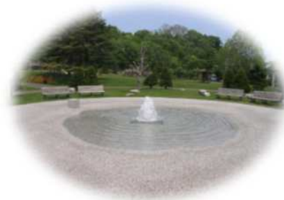
真栄西公園の遊水池(噴水)