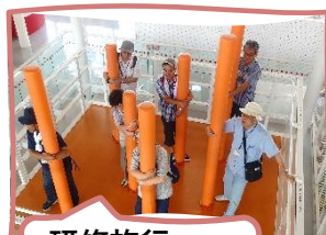
研修旅行 (そなえ～る)