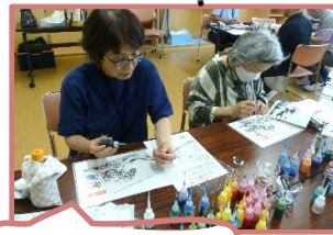
美術 (ディンプルアート)