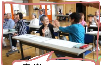
音楽 (みんなで歌いましょう)