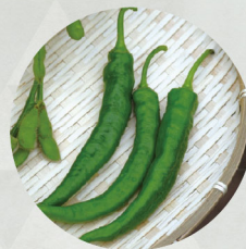
札幌大長 ナンバン