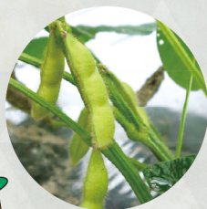
サッポロミドリ (エダマメ)