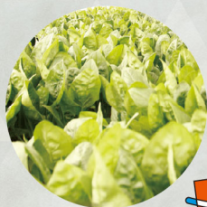
ポーラスター (ホウレンソウ)

清田区はその地名にもある通り、もともとは清らかな水田が広がる農業地帯でした。昭和40年頃からは宅地開発や国の減反政策がきっかけとなり稲作から畑作への転換が進み、今でも栽培されているホウレンソウやキャベツなどが作られるようになりました。現在では、約30戸の農家が真栄・有明地区で野菜や果物、キノコや花などの農作物を生産しています。