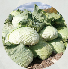
札幌大球 (キャベツ)