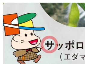
▲ゲームシート6ページ目