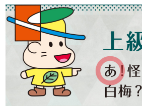
▲上級編第2問 問題内

カレーハメモの答えをもとに、この謎解きの解答欄と同じ法則で□を埋めると、「かゆそめてほたこきよぞあ」となります。これを「あさ→いし」と同じ法則でひとつずつ五十音を進めると、「きよたもとまちさくらだい」となるので、 答えは「清田元町さくら台公園」 です。