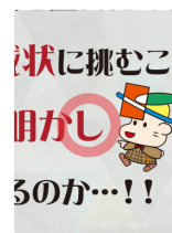
▲ゲームシート 2ページ目