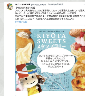
▲2021年9月29日のきよっちNEWSの記事