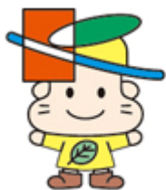
清田区マスコットキャラクター きよっち